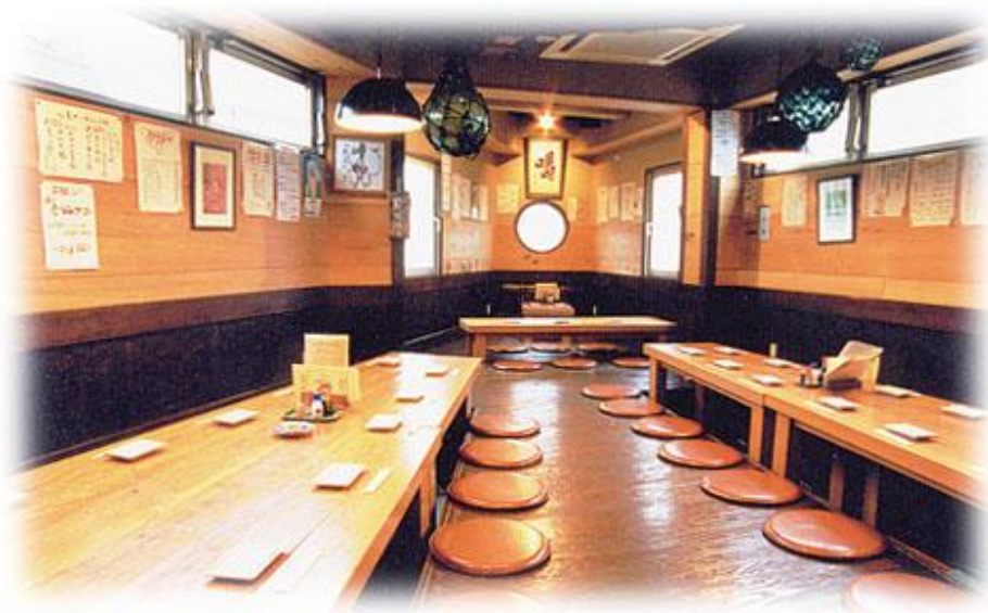
懇親会会場「たつみ本店」の3階を貸切開催(先着60名様)