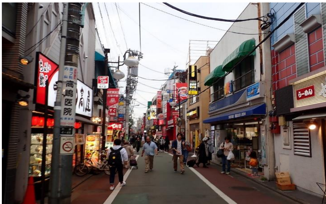
京王線下高井戸駅から日大通り商店街を通過して文理学部キャンパスへ(徒歩7分)