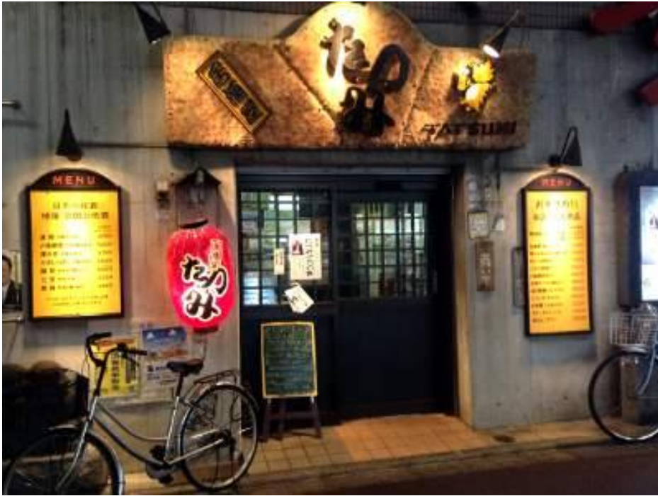
10月19日夜開催の懇親会会場「たつみ本店」:昭和感溢れるレトロな居酒屋