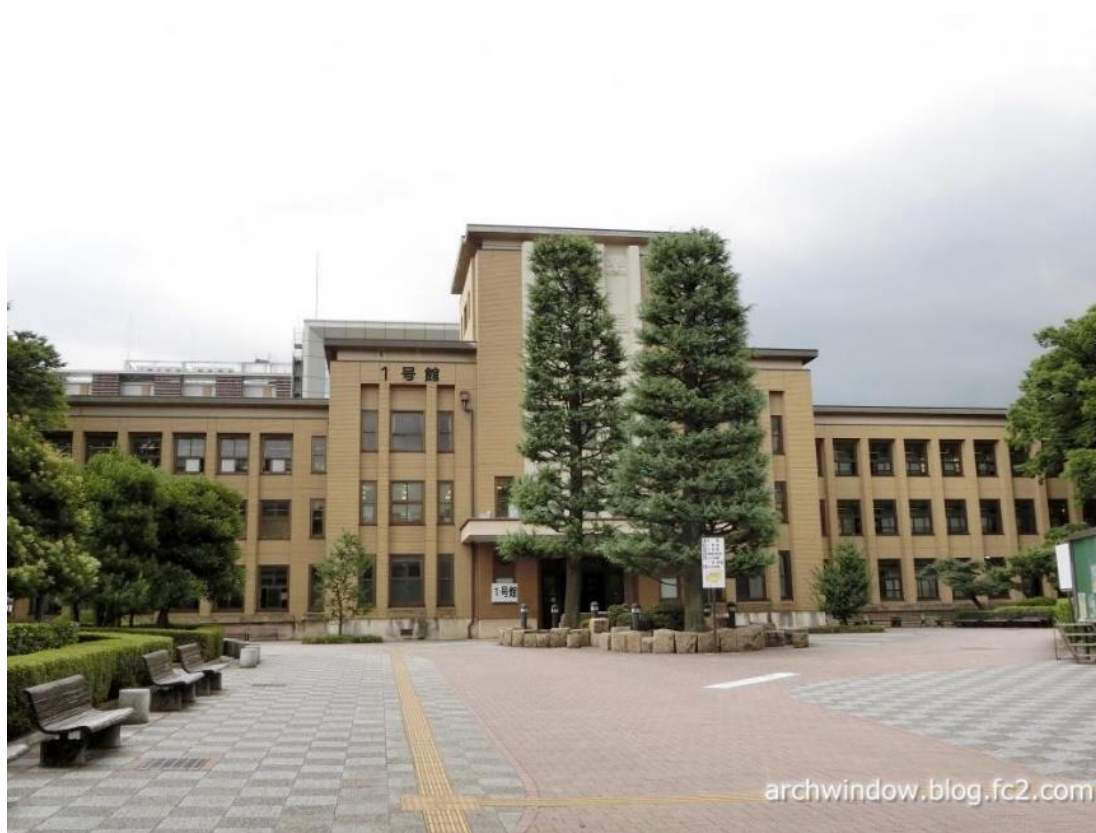
1937(昭和12)年落成の文理学部 1 号館

中等教育の教師教育・教員養成に 120 年以上の歴史・伝統を有しているため、学生の教職志向は高く、学部全体で 3000 人以上が教職課程を履修しています。